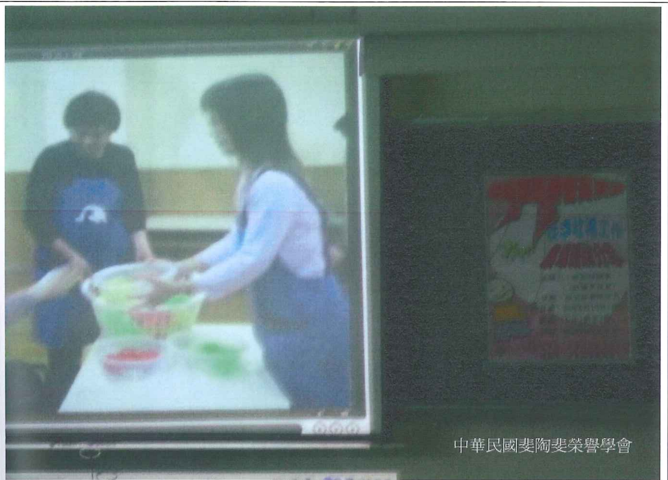
中華民國妻陶妻榮譽學會