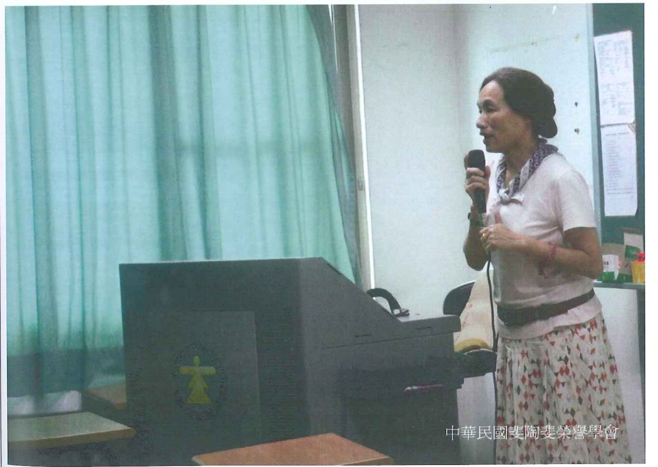
中華民國斐陶斐榮譽學會