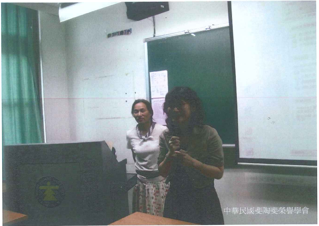
中華民國妻陶妻榮譽學會