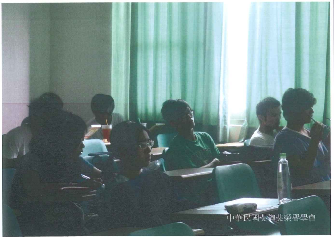
中華民國斐陶斐榮譽學會