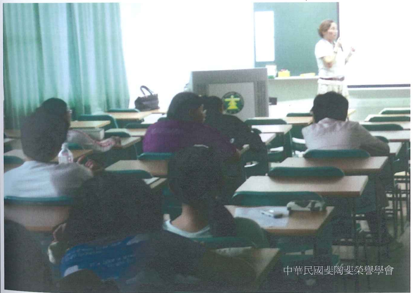
中華民國斐陶斐榮譽學會