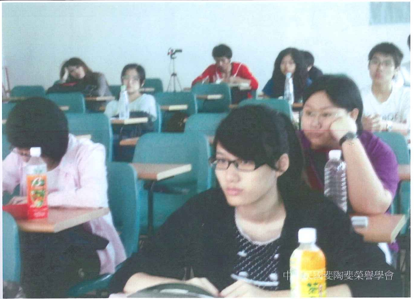
中華民國斐陶斐榮譽學會