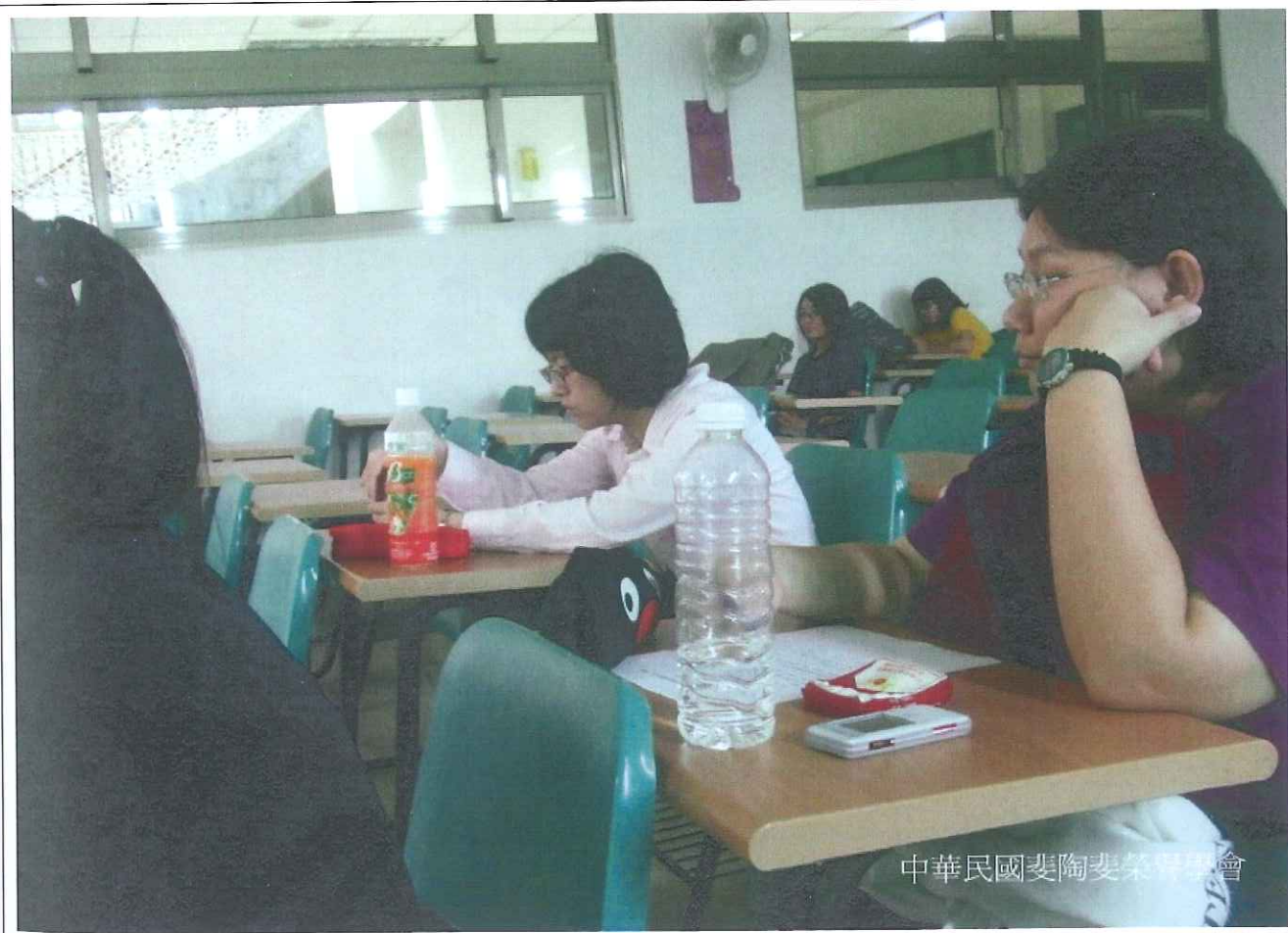
中華民國妻陶妻榮譽學會