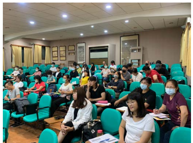
同學專心聆聽講座