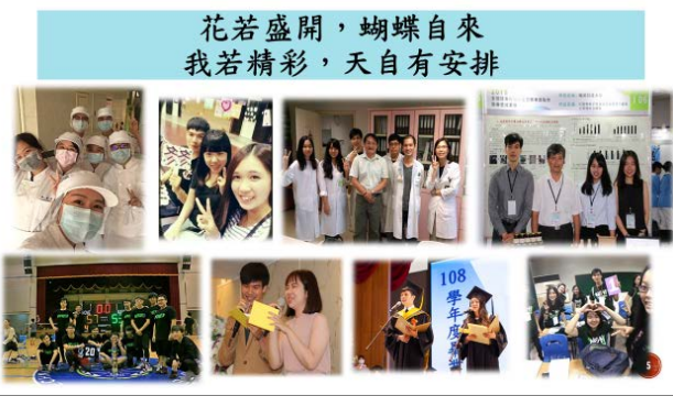
昱升說明學習歷程與各類體驗