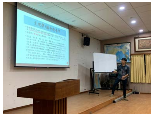
昱升傳授課業學習秘訣