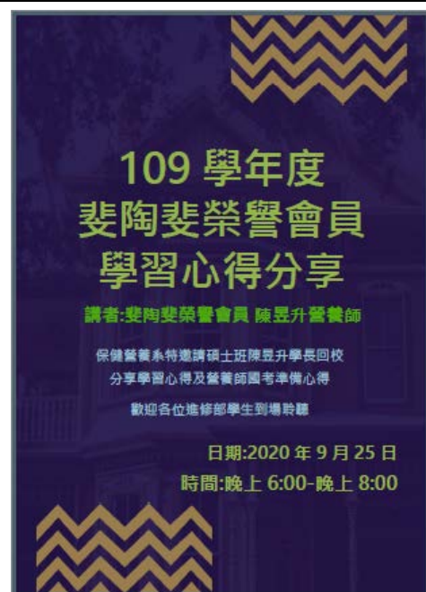
昱升說明得到斐陶斐的故事