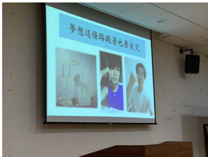
昱升說明實現夢想過程