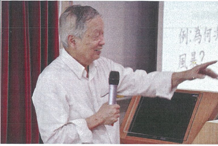
文字說明 (7): Q&A 時間, 李家同教授回答學生問題。